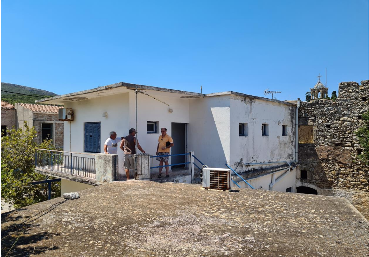
Εικ.3_Εξωτερική Φωτογραφία Ξενώνα