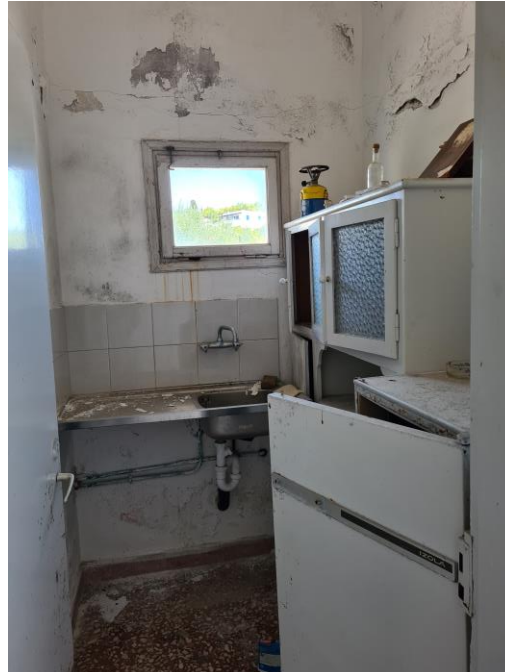
Εικ.4 και 5_ Χαρακτηριστικές Φωτογραφίες του Εσωτερικού του Ξενώνα