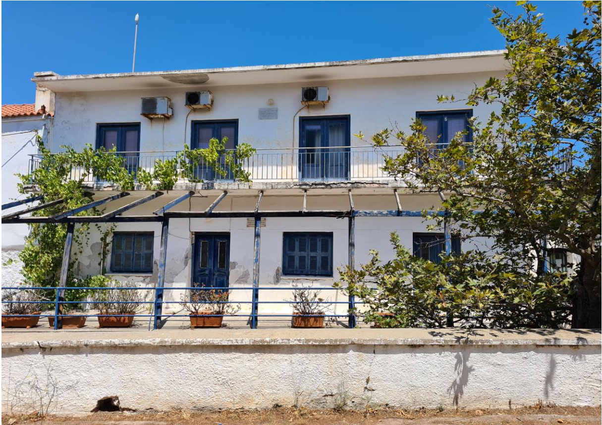
Εικ.2_Εξωτερική Φωτογραφία Ξενώνα